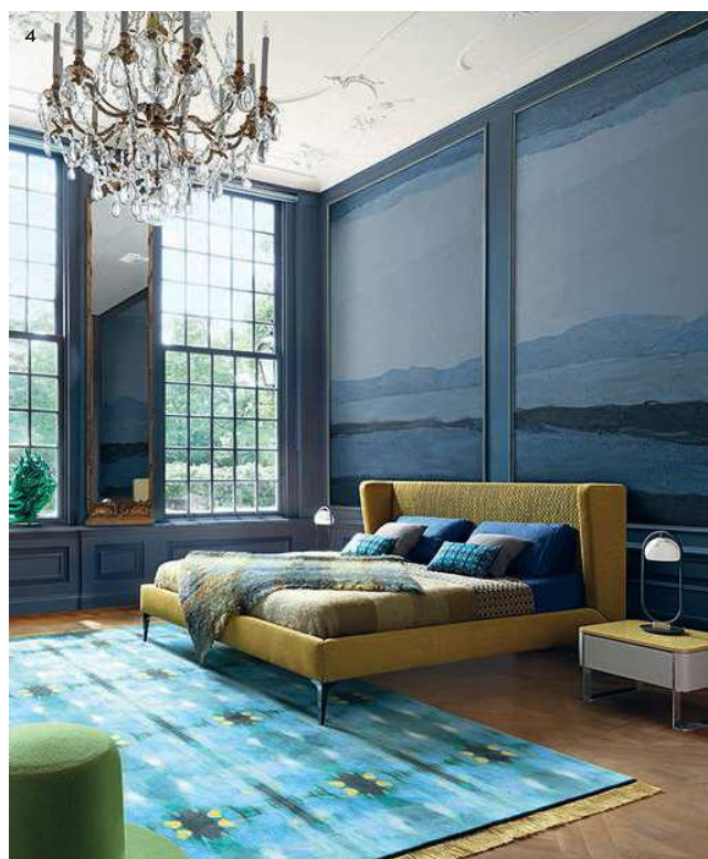
1/ Lit Gabrielle, en collaboration avec Charles Paris, sur mesure, à partir de 30 653 €. Lit National. 2/ Lit New York, design Sergio Bicego, à partir de 3 608 €. Saba. 3/ Lit Desdemone, design Nada Nasrallah et Christian Horner, à partir de 3 603 €. Cinna. 4/ Lit Contre-jour, à partir de 2 940 €. Roche Bobois.