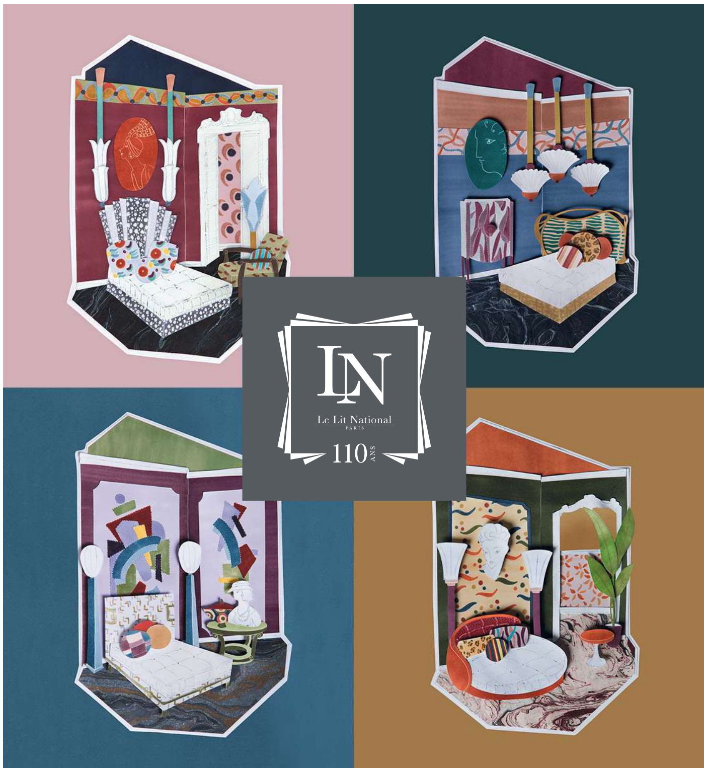
Illustration ©Victor Cadène

110 ans de savoir-faire artisanal d'excellence.